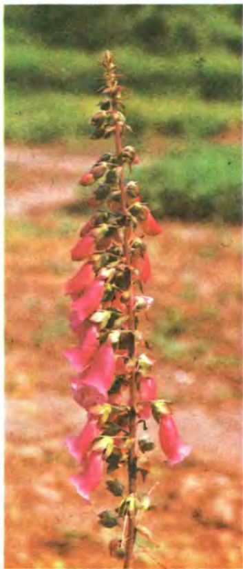
407. Наперстянка пурпурова.